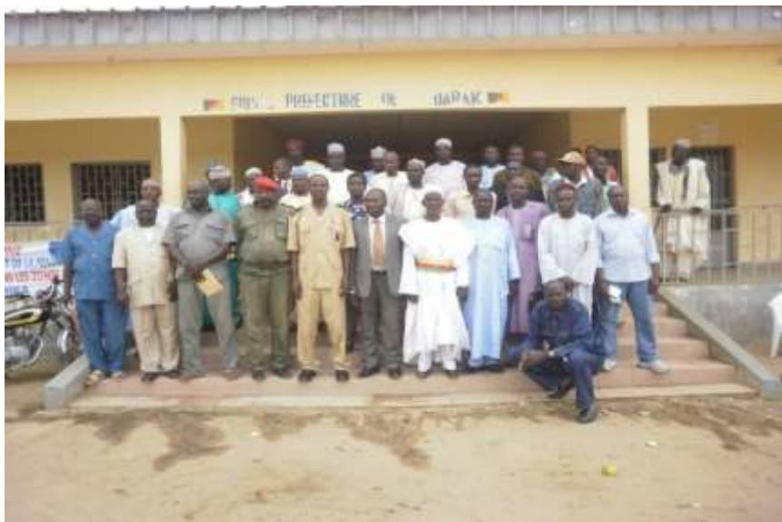
Photo de famille de l'atelier de planification communale de Darak

Programme National de Développement Participatif Cellule Régionale de Coordination de l'Extrême- Nord