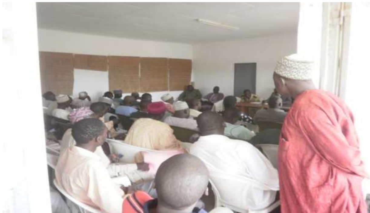
Photo 5 : Participants à l'atelier lors de la restitution des CDMT